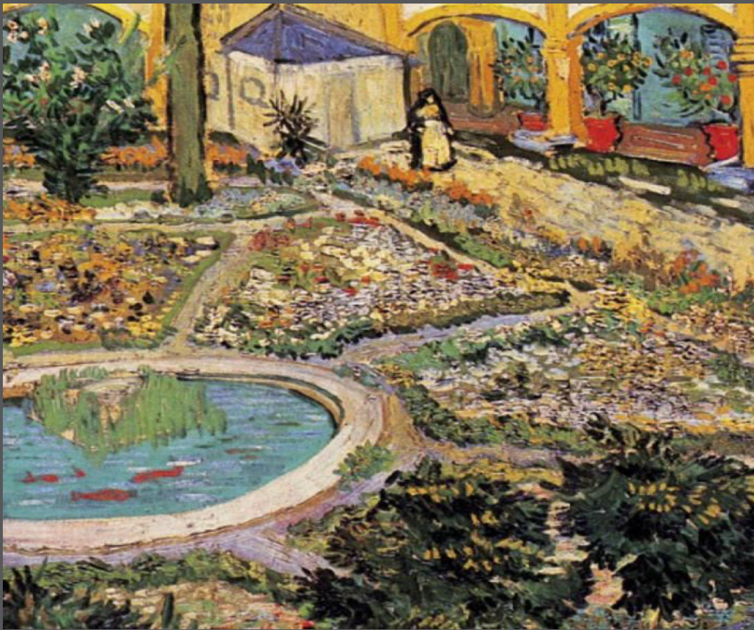
Vincent van Gogh, la Cour de l'hôpital à Arles, 1889. Huile sur toile. Oskar Reinhart Foundation