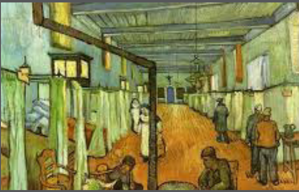
Vincent van Gogh, la salle des malades de l'Hôpital d'Arles