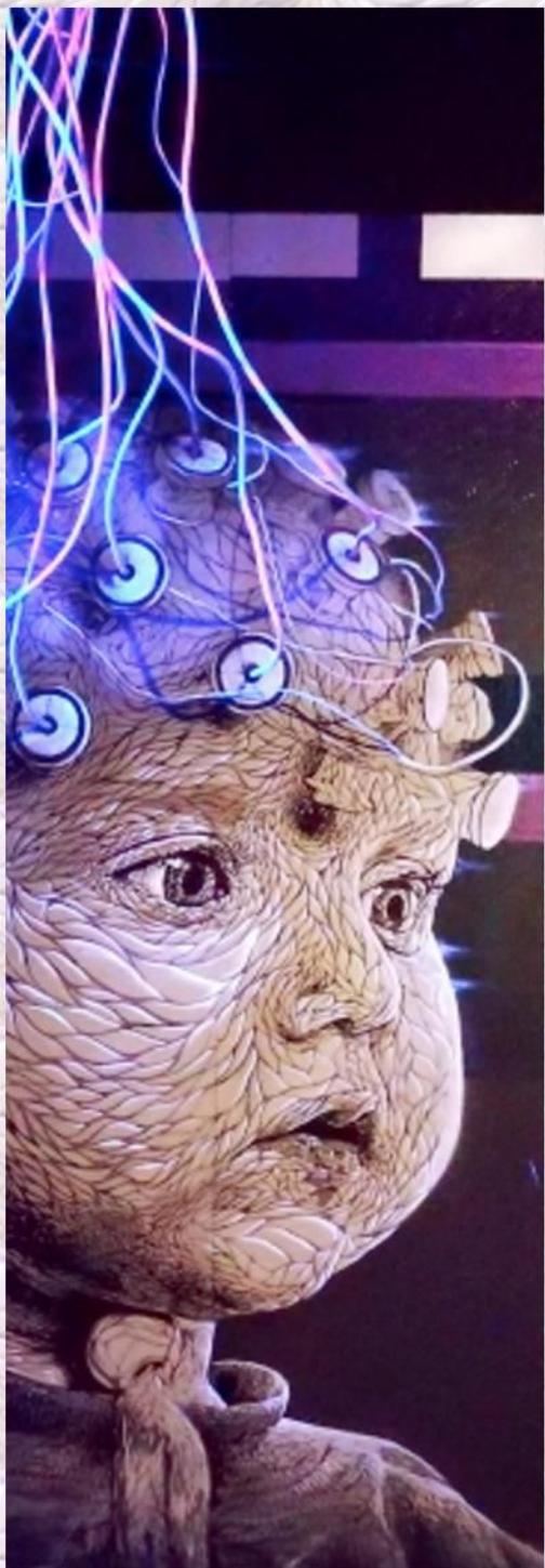
NASTI « Lecture de pensée » Installation (Que décidons-nous de laisser aux consciences de demain?)